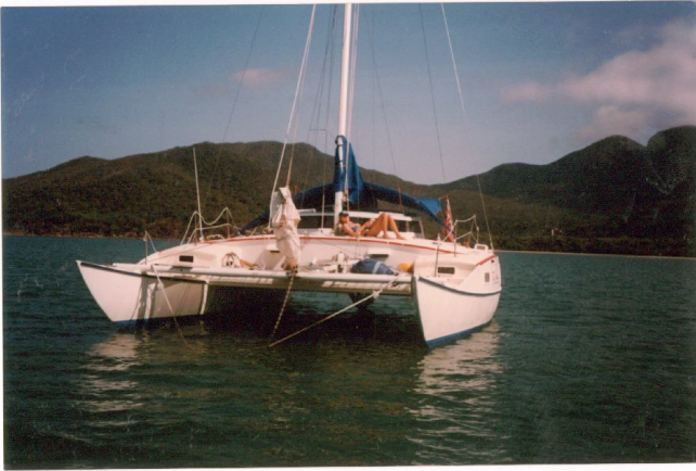
AUSTRALIA: El "Tak Away"