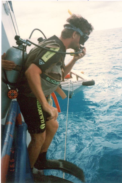
AUSTRALIA: Gran Barrera de Coral. Cairns. Listo para sumergirme (sin aire)