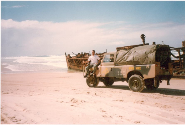
AUSTRALIA: Todo-terreno por las playas de Fraser Island